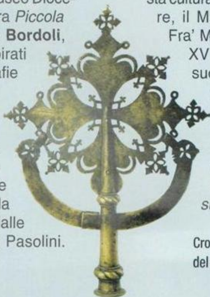
Croce astile in ottone del XVIII secolo

Telefono 041.23.48.118 www.nigra-sum.org